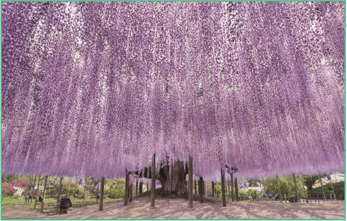
栃木県指定天然記念物にも指定されている大藤棚

どれほどあるかによってお客様の満足度は変わってくると思いますので、魅力的な写真スポットづくりにも常に力を入れています。