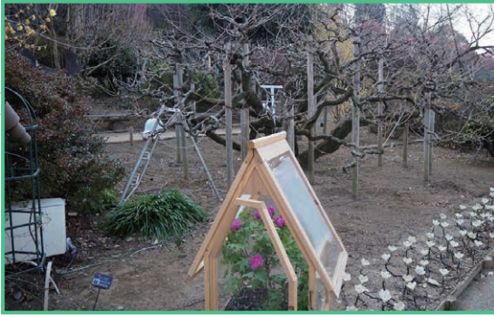
左手に見える管理用の脚立とヘルメット。取材時も木々や草花の手入れが行われていた