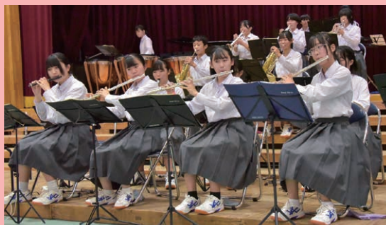
多くの生徒が所属する吹奏楽部の演奏

学校だよりを毎月執筆するにあたり、新しい時代に対応した文理融合を念頭に、情緒的、文学的事象にも科学的な示唆を入れていくことに努めました。また、IT化や効率化を急ぐ社会や、災害や戦争等が頻発する中で、多様性・多文化共生・人権など、豊かな社会や豊かな心につながる芸術（音楽）文化の重要性を発信しました。（池谷英人）