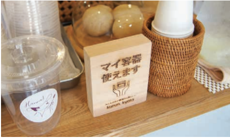
「くるん京都」オリジナルの手作りプレート（撮影協力：タルティエヌとコーヒートはんな）

— 2023年には、京都市温暖化対策室の一事業として「くるん京都」主催のイベントが行われたそうですね。