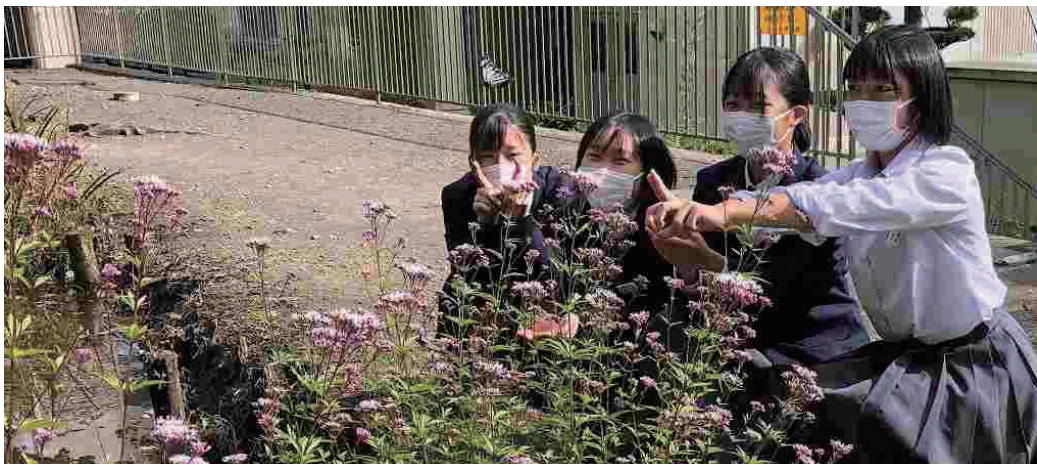
島田二中ビオトープに飛来したアサギマダラ

11月の島田二中のビオトープでは、アサギマダラだけでなく黄色が鮮やかなツマグロヒョウモンや美しいアオスジアゲハ等が舞い楽しませてくれました。その数も日に日に少なくなり、島田市にも冬がやってきました。島田二中に来たアサギマダラたちも、時に1日200km以上を旅し、なんと1,000km～2,000kmを越える一生で最後の旅に出ています。何を合図に渡り、どうやって目的地に着くのか、なぜ何千キロも渡るのかなど、その旅路に思いをはせて見送ってあげるのもよいでしょう。