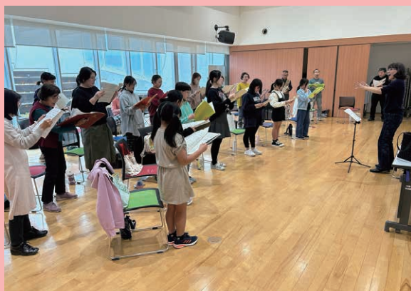
「おおいなる川 ～はるかな旅へ～」の練習風景。島田市内の公民館にて

教育会館の目的の一つ「教育文化への寄与」を念頭に、静岡県内の風景や歴史等を題材に委嘱した合唱曲「おおいなる川 ～はるかな旅へ～」 「いにしえの道」（作詞・作曲：ミマス／編曲：富澤裕）は、教育芸術社からオリジナル合唱ピースとしてリリースされています。作曲家のミマスさんとは10年ほど前に静岡県内で開催された天文観測会で初めてお会いし、親しみやすいお人柄や広く深い知性と豊かな人間性にたいへん感銘を受けました。現在3曲目を委嘱しています。