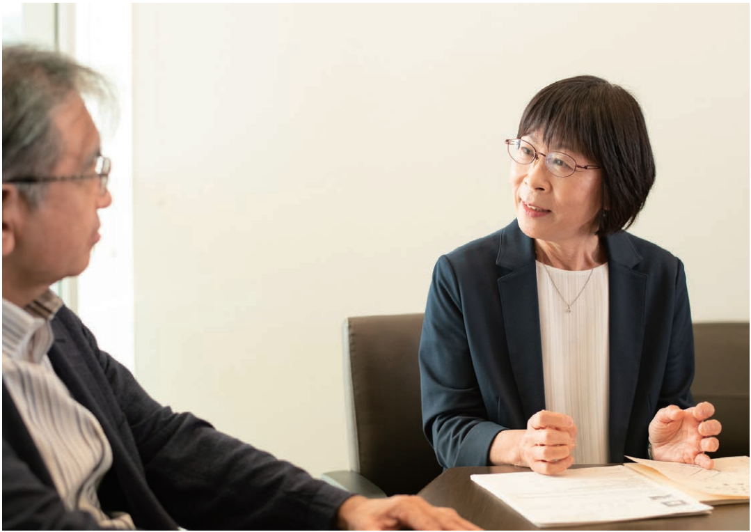
取材は 2024 年 4 月 26 日、芸術科学研究所にて行われた