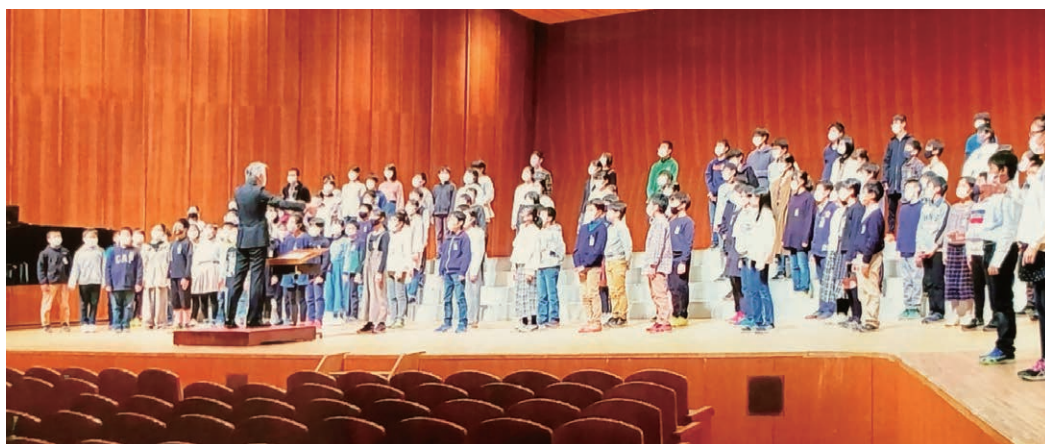
児童、教職員の粋な計らいにより、音楽会で指揮をさせていただきました

2学期は、修学旅行、運動会、12月の集会などがあります。その実施については、このコロナ禍の中では状況が日々変化することもあり、判断の機会も複数回あると思われます。「できる理由を探して」柔軟な対応で最適解を求めましょう。