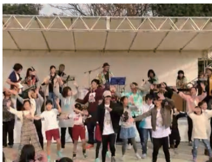
PTAバンドの演奏で、子どもと教職員でダンスを披露 (地域のお祭りにて)

「教師になったときの思い」を、または教職を積み重ねて今新たに生まれている「教育への思い」や「こんな子どもたちを育てたい！」という熱い思いをもち、子どもたちの「夢」にかけていただけたらと思います。