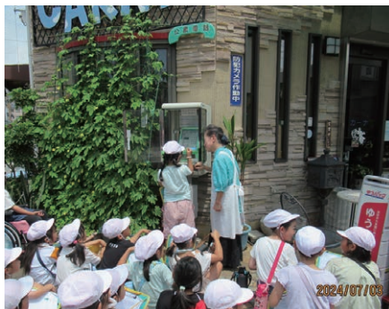
「公衆電話教室」の様子