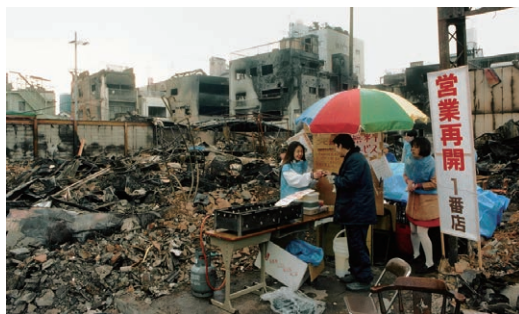
ガレキの中に再開した喫茶店。復旧工事にたずさわる人たちに好評だ = 1995年2月5日、神戸市須磨区寺田町