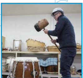
その状態のまま革面を槌で叩いて張り加減を調整する