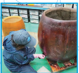
経年劣化した和太鼓の胴に、漆を塗って艶を出す作業