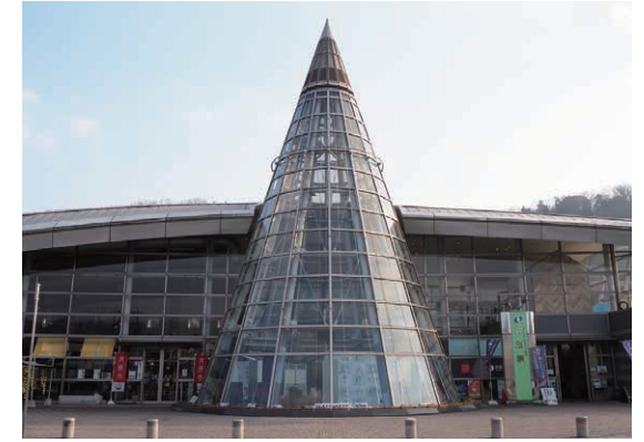
お披露目の会場となった井原駅

音を確かめたり、友達どうして互いの作品を聴き合ったりしながら、慣れた手付きで作業を進めていきました。