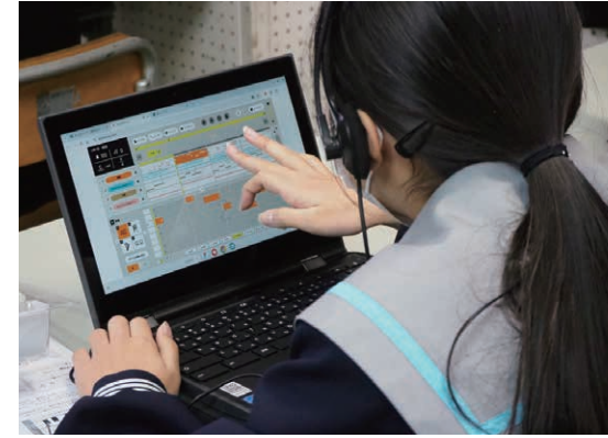
慣れた手付きで端末を操作する生徒たち

今回参観するのは、川野亨先生による音楽科創作の授業です。「カトカトーンで井原鉄道の列車接近メロディーをつくらう」と題し、プラットフォーム上で使用する“駅メモ”と呼ばれる音楽を、カトカトーンを用いて創作します。