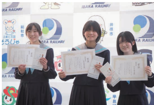
表彰後に笑顔を見せる生徒たち

青森県の津軽五所川原駅と津軽中里駅を結ぶ津軽鉄道。冬の時期の名物として名高いストーブ列車。その名の通り、車内には石炭を燃料とするダルマストーブがある。 使われる車両は昭和20年代に製造された昔懐かしい旧型客車だ。一般的なディーゼル車に牽引される形での運行。ゆったりとしたスピードで、津軽の冬景色を進む。車内ではストーブの上で焼いて食べられるスルメを買うことができる！香ばしく旨みたっぷりのスルメを齧りながら、ダルマストーブにじんわり温められ、旧型客車の軋み音と共にゆったり味わう冬景色。決して他では味わえない時間の進み方。 案内放送の津軽弁の響きに癒されながらあつという間に終点に。帰りは反対側の車窓を見ようかな。