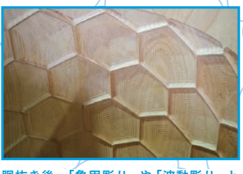
胴抜き後、「亀甲彫り」や「波動彫り」と呼ばれる彫刻を施すことによって、太鼓の残響をよくする効果がある