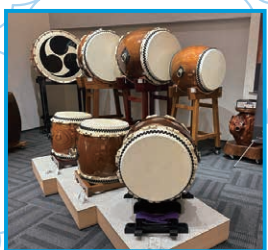
完成した和太鼓。ショールームにはさまざまな太鼓が並び、

浅野…全国で開催されている和太鼓のコンテストに出演してみたり、自分たちでオリジナルの曲をつくって演奏してみたりと、型にとらわれず、さまざまなことにチャレンジしてほしいと思います。舞台で演奏する太鼓は古くからあるようで、実はまだ50年ぐらいの歴史しかありません。新しい分野の楽器だと思っ て、さまざまな演奏活動や新たな曲づくりに励んでもらえたらうれしいです。