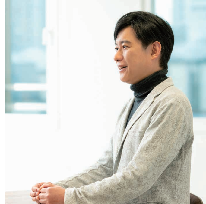
取材は2025年1月6日、教育芸術社にて行われた

道山 ：そうですね、分かりやすさを重視して迎合するようなプログラムというよりも、こちらの持っているレパートリーをしっかり聴いてもらうようにしていますね。たまに、分かりやすいつてなんだろうと思うときがあるんです。分かりやすいと感じているのは実は大人だけで、子どもはあんまりそういうことを考えずに、おもしろいものはおもしろ