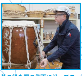
革の縁を胴の側面に沿ってロープで締め上げながら、時間をかけて革を伸ばす「革張り」