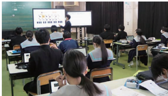
2024年12月24日に参観した授業の様子