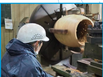
専用の機械で行われる「胴抜き」の作業